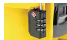
Lucchetto approvato TSA